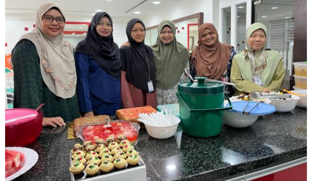
Program AKRAB UNITED 2023