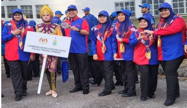
Perbarisan Hari Kebangsaan Tahun 2023