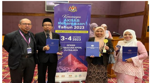
Majlis AKRAB Kebangsaan Tahun 2023