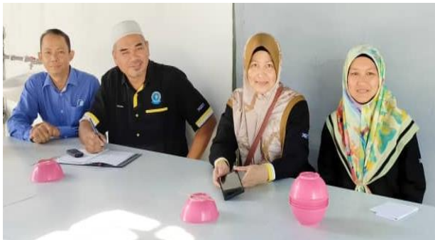
Explorace Integriti 2023