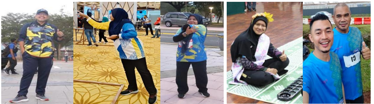
MAKSPEN KKW Putrajaya 2023